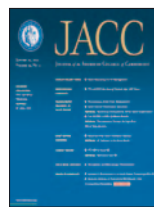
Journal of the American College of Cardiology 70(15):1846-1857, Oct 2017