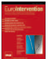
Eurointervention 13(5):578-584, Ago 2017