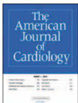
American Journal of Cardiology 119(10):1616-1622, May 2017