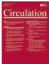
Circulation 136(3):263-276, Ago 2017