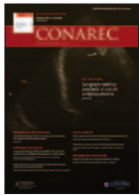
Revista CONAREC 33(140):157-161, 2017

Novedades en Cardiología resalta artículos publicados durante el bimestre anterior en el sitio siicsalud.com , el sitio oficial de la Sociedad Iberoamericana de Información Científica (SIIC). Los conceptos que acompañan a los títulos derivan hacia los artículos completos que el lector podrá consultar copiando las direcciones de sus páginas o mediante el escaneo del correspondiente CRR (Código Respuesta Rápida). Novedades en Cardiología es una publicación que integra el Programa Actualización Científica sin Exclusiones (ACISE) en Cardiología, desarrollado por la Fundación SIIC con el patrocinio de Laboratorios ARGENTIA.