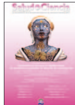
Salud i Ciencia 22(5):430-436, May-Jun 2017